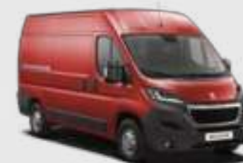
Rouge Tiziano (1)