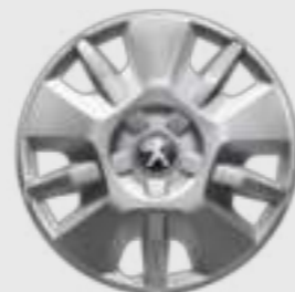
Capac de roată de 15" pentru versiunea ușoară

Descoperă cele 5 modele de capace de roată sau jante de 15" și 16".