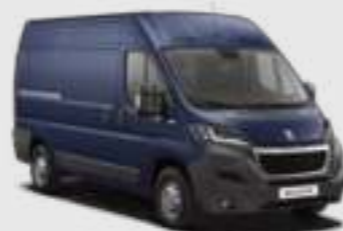
Bleu Imperial (1)