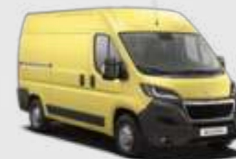
Jaune Carioca (1)