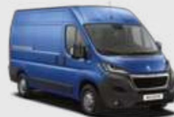
Bleu Line (1)