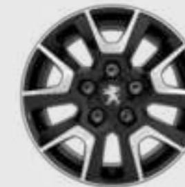
Jante din aliaj de 16" BRIERE pentru versiunea ușoară

* Dotare standard, opțională sau indisponibilă, în funcție de versiune.