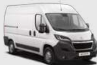
Blanc Banquise (1)

Alege dintr-o gamă de 10 nuanțe opace sau metalizate.