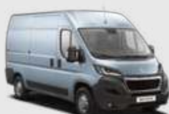
Lago Azzuro (2)