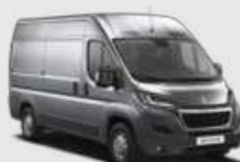
Gris Artense (2)