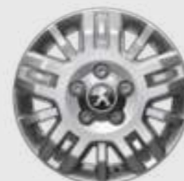
Jante din aliaj de 15" pentru versiunea ușoară