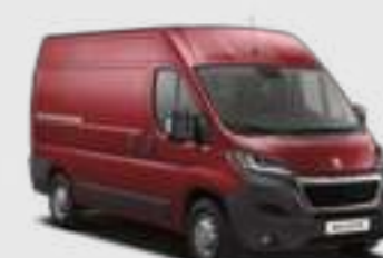
Rouge Profond (2)