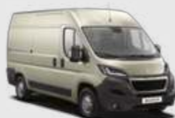
Golden White (2)