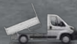
Benă pe șasiul cabinei