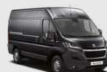
Gris Graphito (2)