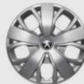
Capac de roată de 16" pentru versiunea ușoară