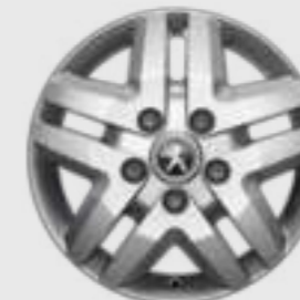
Jante din aliaj de 16" pentru versiunea ușoară