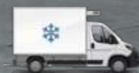
Celulă raportată la șasiul cabinei

(Exemple de transformări și ornamente efectuate de carosieri, non-contractuale).