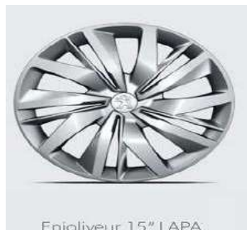
Enjoliveur 15" LAPA