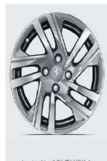
Jante Alu 16" TAKSIM