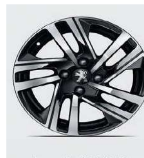
Jante Alu 16" SOHO