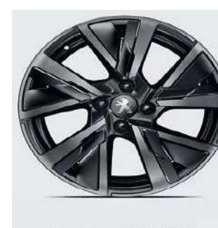
Jante Alu 17" BRONX